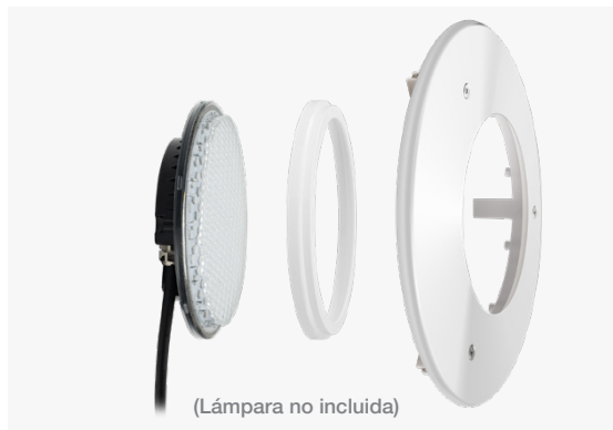
(Lámpara no incluida)